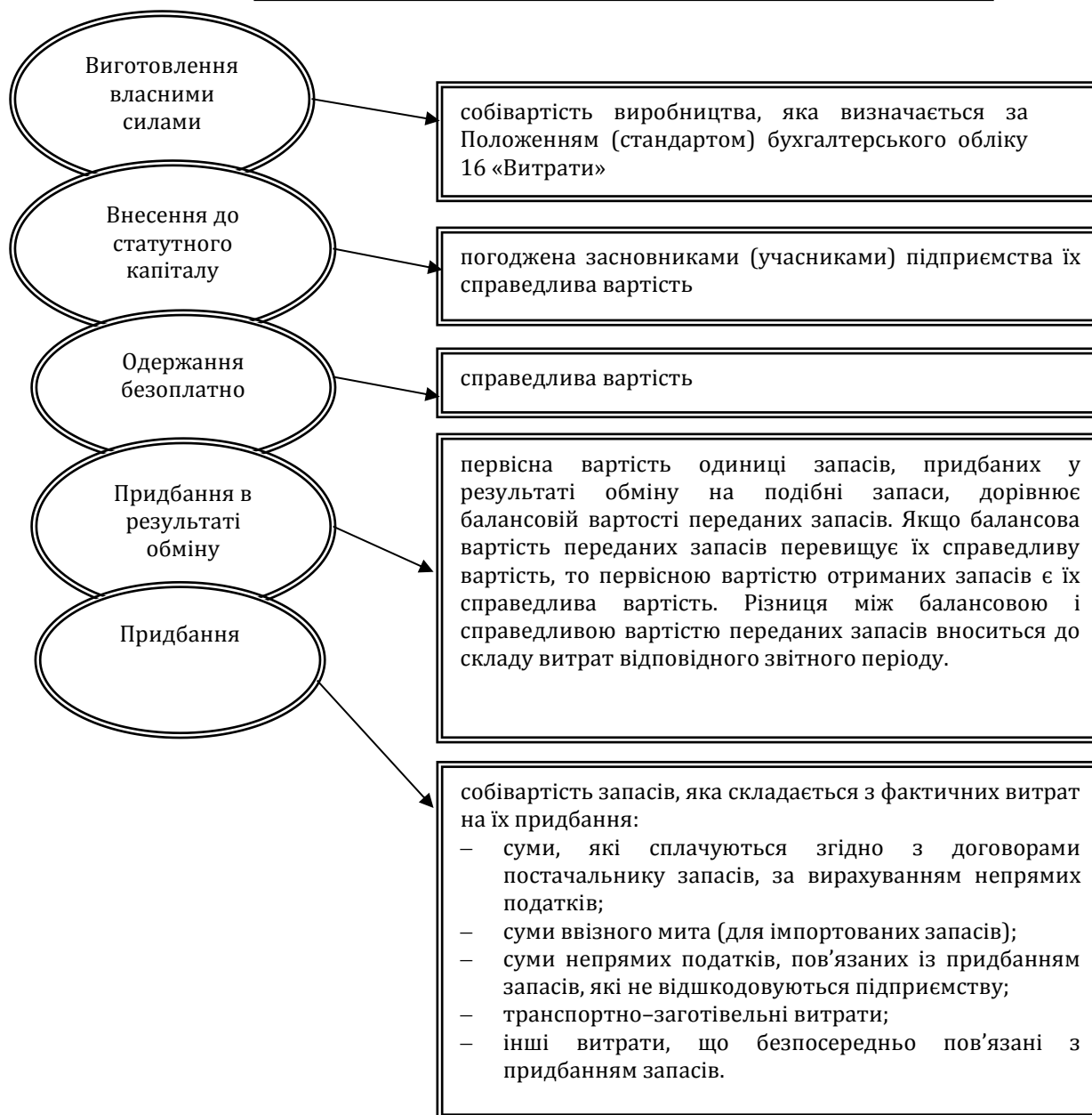
Рис. 1. Формування первісної вартості запасів залежно від джерел їх отримання

Якщо чиста вартість реалізації раніше уцінених запасів на дату балансу збільшується, то на суму цього збільшення, але не більше суми попередньої уцінки, визнається збільшення вартості цих запасів та іншого операційного доходу [5].