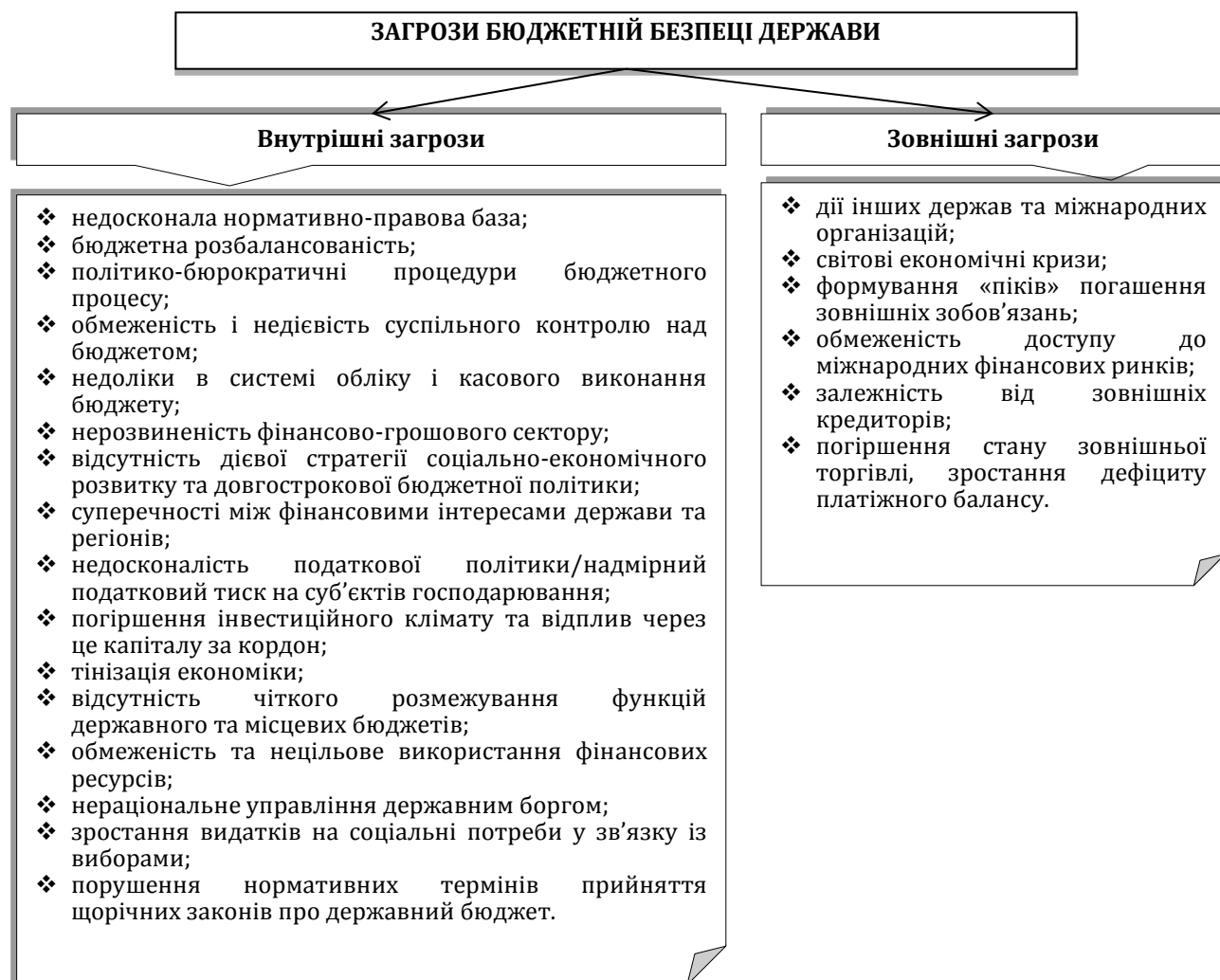
Рис. 1. Джерела загроз бюджетній безпеці України

Аналіз наявних внутрішніх та зовнішніх загроз бюджетній безпеці дає підстави визначити серед них низку складових (рис. 1).