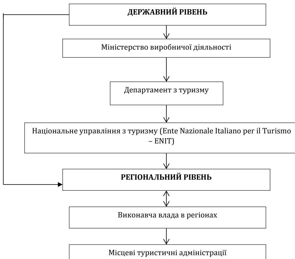
Рис. 3. Схема управління туристично-рекреаційним сектором Італії на державному і регіональному рівнях