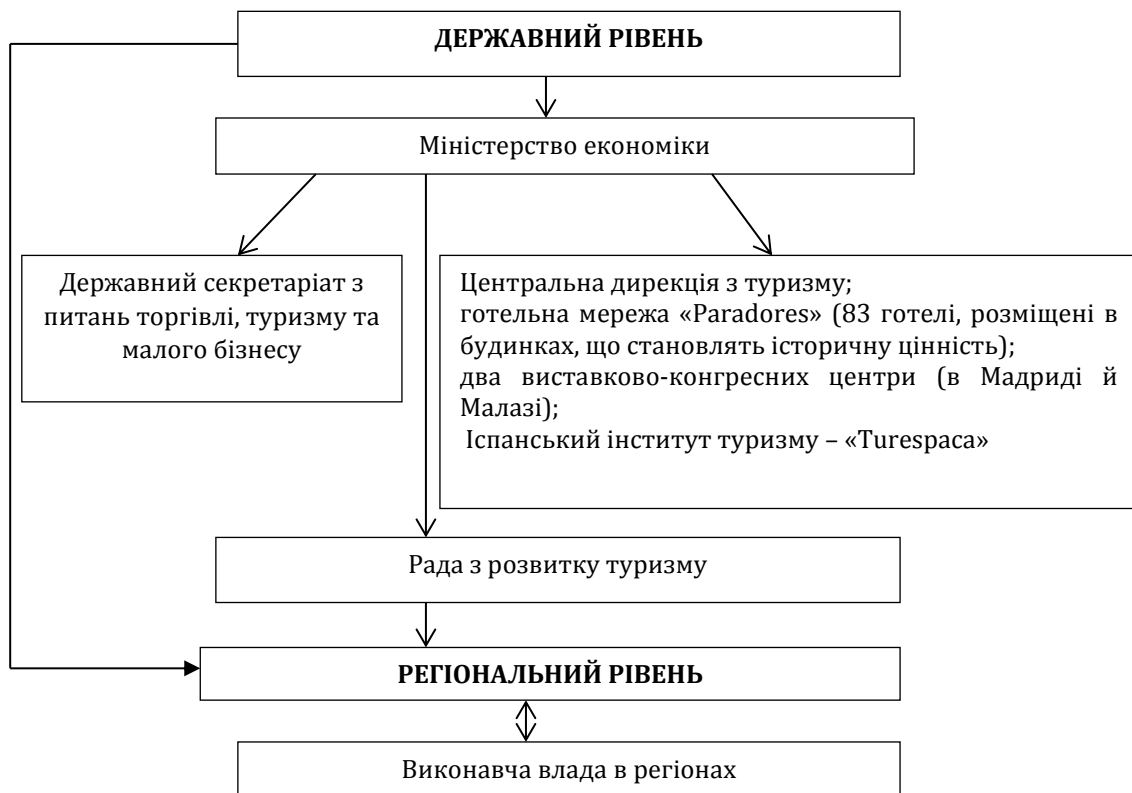
Рис. 2. Схема взаємодії органів з управління сферою туризму і рекреації на державному та регіональному рівнях в Іспанії

*Складено авторами з використанням [6; 8; 9].