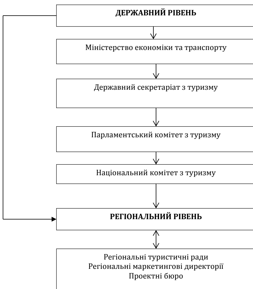
Рис. 5. Управління туризмом і рекреацією Угорщини на державному і регіональному рівнях

*Складено авторами з використанням [6; 9]