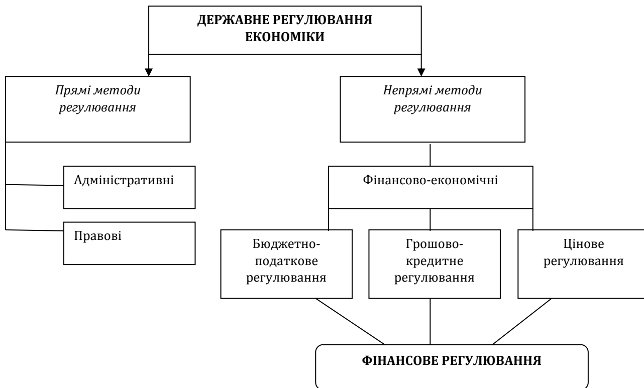
Рис. 1. Місце фінансового регулювання в системі державного регулювання економіки

характеру щодо впливу на діяльність суб'єктів господарювання, у тому числі й в аграрному секторі [11].