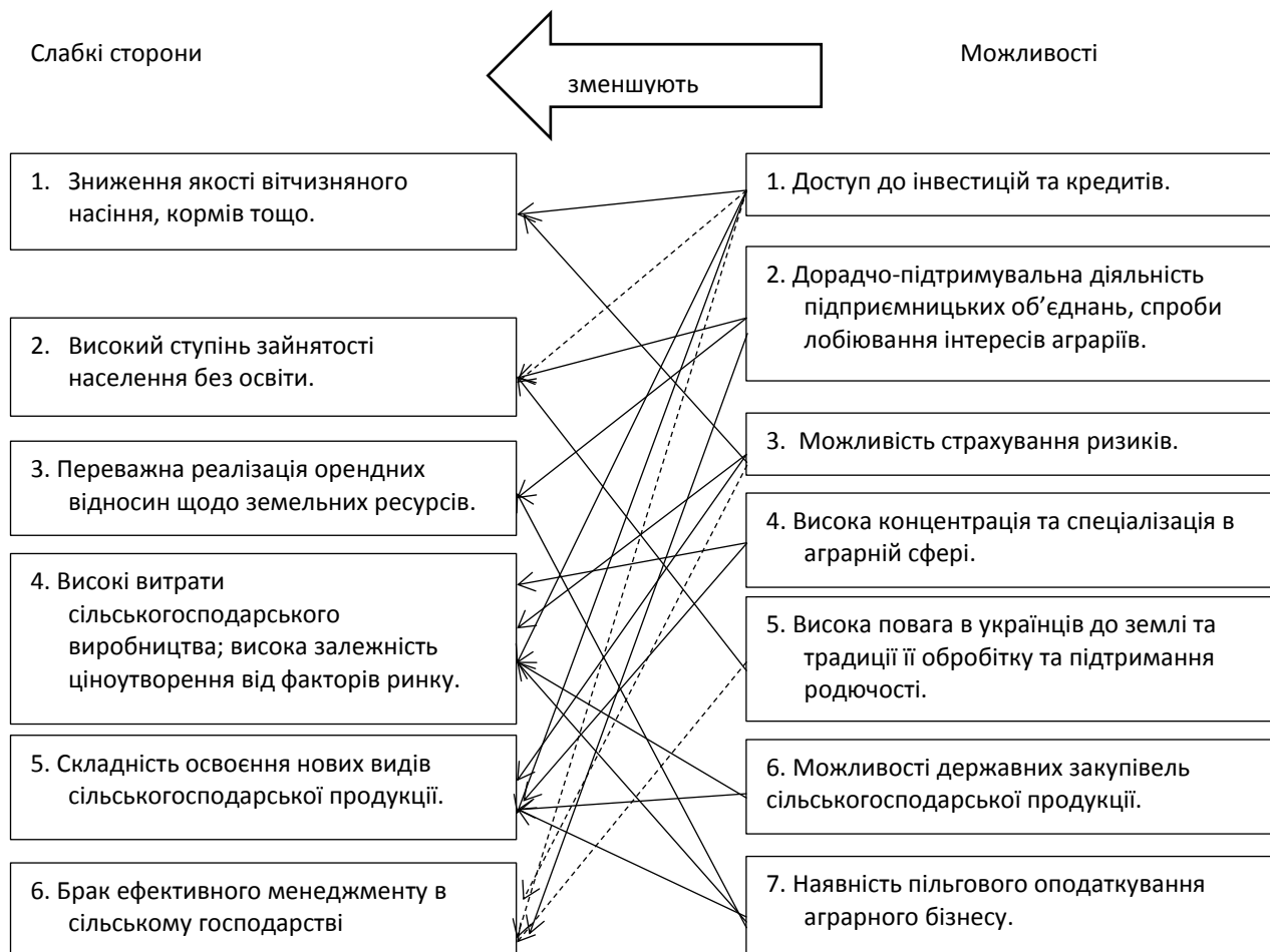
Рис. 2. Виклики управління використанням земельних ресурсів сільськогосподарських підприємств

переважання орендних земельних відносин між сільськогосподарськими підприємствами та власниками сільськогосподарських земель; високої витратності сільськогосподарського виробництва та високої залежності ціноутворення від не завжди сприятливої кон'юнктури ринку; складності освоєння нових видів продукції; браку ефективного менеджменту в сільському господарстві.