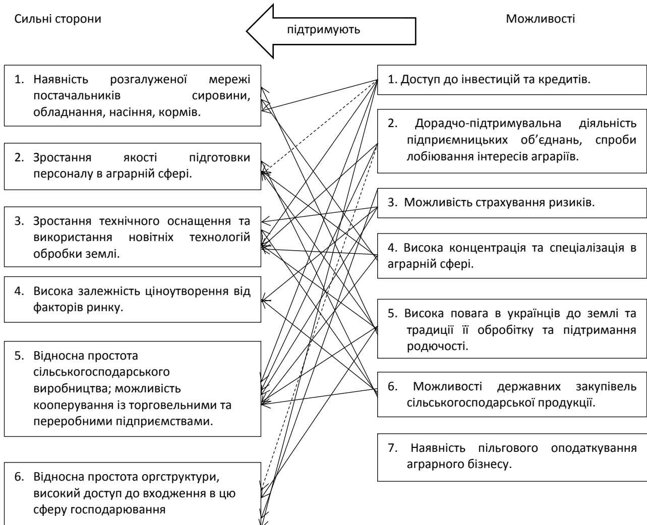
Рис. 1. Порівняльні переваги управління використанням земельних ресурсів сільськогосподарських підприємств

середовища сільськогосподарських підприємств. Відзначено можливості, які даються ззовні державою, діловими об'єднаннями, партнерами та суспільством. Визначено, що вони підтримують можливості забезпечення якісним насінням, кормом, поголів'ям тощо; можливості залучення кваліфікованого персоналу в сільськогосподарські підприємства; розвиток технологій та їх упровадження в аграрну сферу, насамперед - в обробку землі; можливості сприятливої ринкової кон'юнктури для максимізації доходу; розвитку конкурентного середовища в сільськогосподарському виробництві, що впливає позитивно не лише на якості сільськогосподарської продукції, але й у використанні земельних ресурсів – ефективніше, раціональніше, продуктивніше. Управління використанням земельних ресурсів, спрямоване на підвищення ефективності їх використання, повинно відбуватись за вмілого використання сильних сторін сільськогосподарських підприємств та із урахуванням можливостей ззовні.