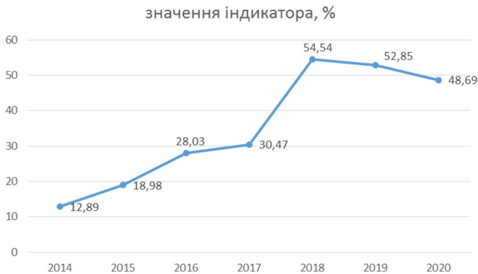
Рис. 2. Частка простроченої заборгованості за кредитами в загальному обсязі кредитів, наданих банками резидентам України.

Починаючи з 2019 р. частка простроченої заборгованості за кредитами в загальному обсязі кредитів, наданих банками резидентам України починає зменшуватися, проте залишається на критичному рівні.