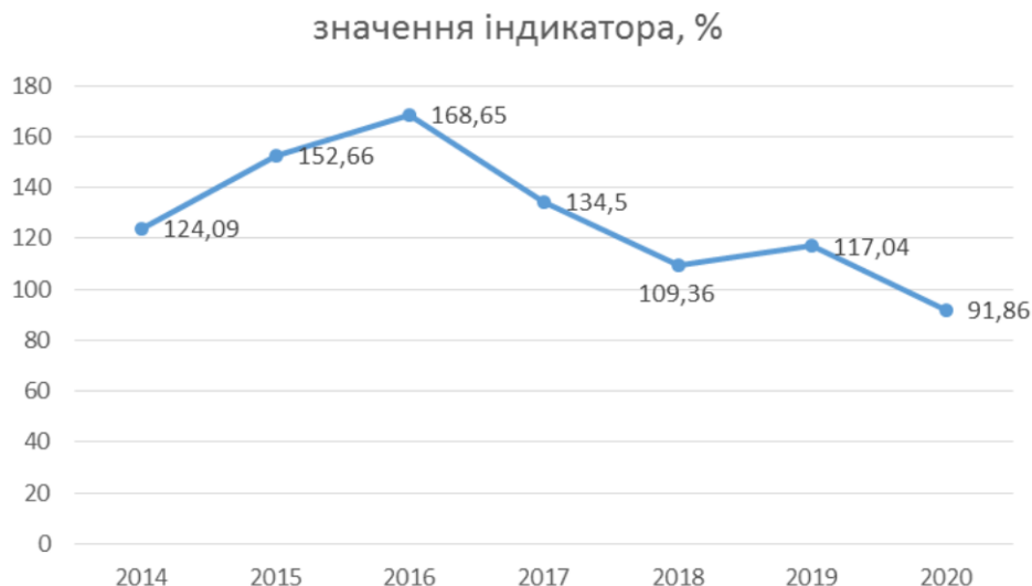
Рис. 3. Співвідношення банківських кредитів та депозитів в іноземній валюті в Україні.