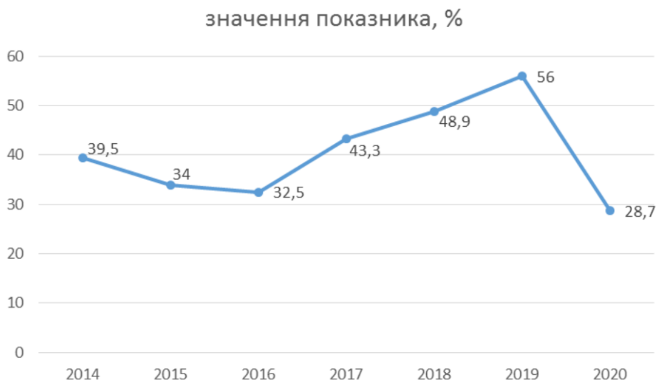
Рис. 4. Частка іноземного капіталу у статутному капіталі банків в Україні