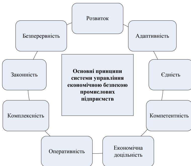
Рис. 1. Принципи системи управління економічною безпекою промислових підприємств*

Суб'єкти системи управління економічною безпекою можна поділити на внутрішні (працівники підприємства) та зовнішні (держава та її інститути, банки, конкуренти, посередники, споживачі, постачальники).