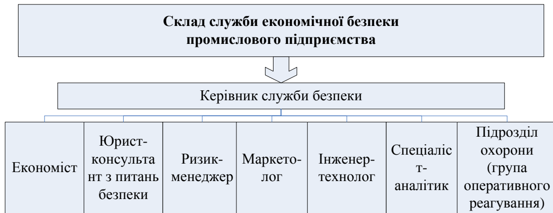
Рис. 3. Склад служби економічної безпеки промислового підприємства*

створення таких служб не є поширеним явищем, що є однією з ключових проблем управління економічною безпекою та зумовлює її низький рівень.