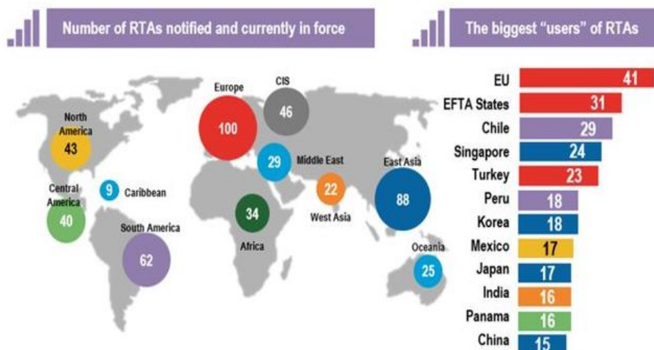
Рис. 1. Регіональний розподіл нотифікованих та діючих RTAs (січень-червень 2019 р.) *

* побудовано авторами на основі даних COT https://rtais.wto.org/UI/PublicMaintainRTAHome.aspx .