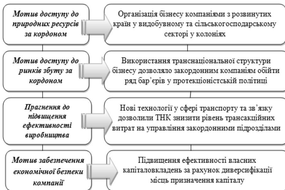
Рис. 1. Основні складники генезису ТНК у світовому господарстві*

на власну користь. Пошук сучасними ТНК нових, більш стабільних умов власного функціонування через диверсифікацію напрямів вкладення капіталу теж зміцнює їхні позиції як одного з головних суб'єктів геоeкономіки.