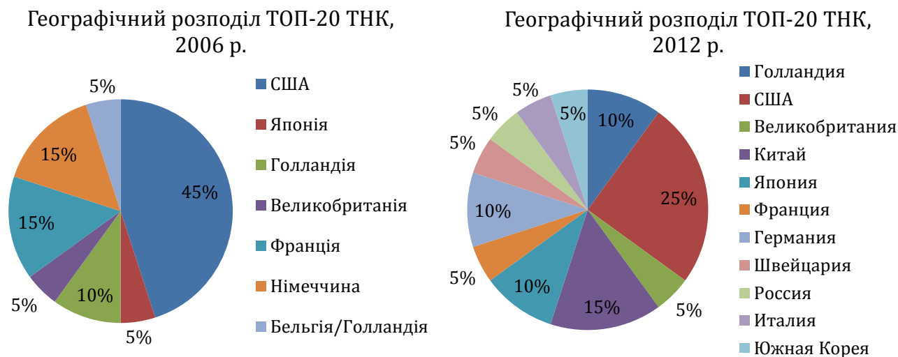
Рис. 4. Систематизація динаміки географічного розподілу рейтингу найбільших ТНК у 2006 р. та 2012 р. *

географічній структурі пов'язані із перерозподілом капіталів, використовуваних компаніями, і в посиленні позиції держав, корпорації з яких уперше потрапили до списку.