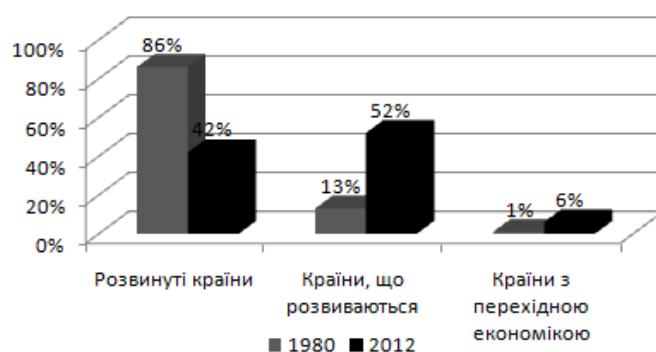
Рис. 3. Розподіл залучених ПІІ за групами країн, % *

Так у період з 1980 р. до 2012 р. особливо посилили свої позиції країни, що розвиваються, оскільки у 1980 році найбільший обсяг залучених інвестицій припадав на розвинені країни (86 %), а у 2012 році їх обсяг скоротився практично в 2 рази, тобто складав 42 %. За цей період країни, що розвиваються, збільшили обсяг залучених інвестицій у 4 рази, і в 2012 році їх обсяг складав 52 % усього світу, що на 10 % більше, ніж обсяг інвестицій розвинутих країн.