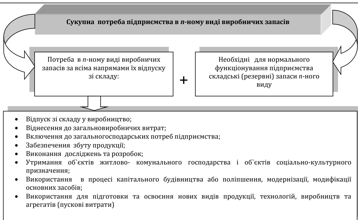
Рис. 1. Структурно-логічна схема оцінки загальної потреби підприємства у конкретному виробничому запасі